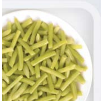
Cut wax beans Gebroken boterbonen Haricots jaunes coupés Wachsbrechbohnen Judías redondas mantecadas trozos Fagiolini gialli tagliati