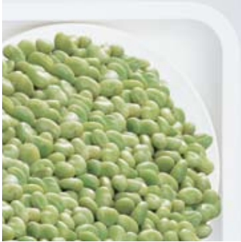
Broad beans Tuinbonen Fèves de marrais Dicke Bohnen Habas finas Fave fini