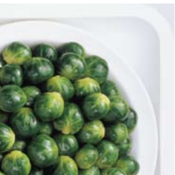
Brussels sprouts Brusselse spruitjes Choux de Bruxelles Rosenkohl Coles de Bruselas Cavolini