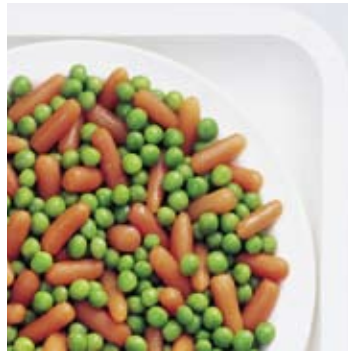
Garden peas and carrots Tuinerwten en wortelen Petits pois et carottes Markerbsen und Fingermöhrrchen Guisantes y zanahorias Piselli e carotine