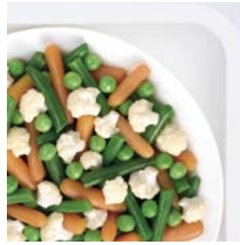
Summer mix Zomergroenten Mélange d'été Sommergemüse Mezcla de verano Verdure d'estate