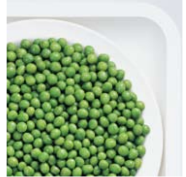
Garden peas Tuinerwten Petits pois Markerbsen Guisantes Piselli