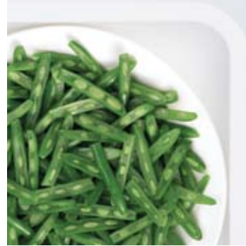
Sliced Dutch green beans Hollandse snijbonen Haricots plats coupés en lanières Holländische Schnittbohnen Judías verdes holandesas en tiras Fagiolini olendesi a strisce