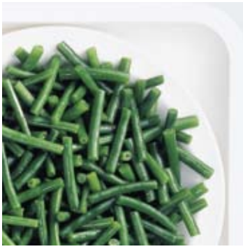
Cut green beans Gebroken sperziebonen Haricots verts coupés Brechbohnen Judías verdes redondas trozos Fagiolini tagliati