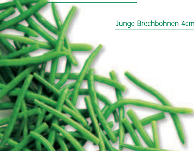
Junge Brechbohnen 4cm

Ganze Bohnen extra fein Prinzessbohnen sehr fein Delikatessbohnen fein Ganze Bohnen mittelfein