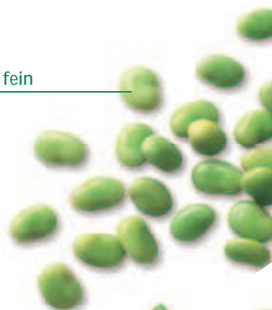
Dicke Bohnen fein